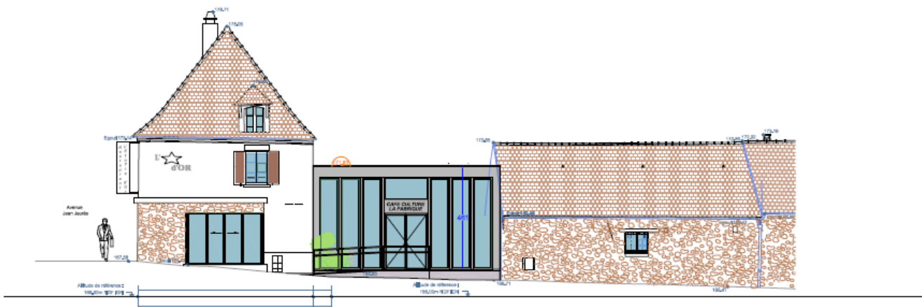
FACADE RUE DE L'ABREUVOIR