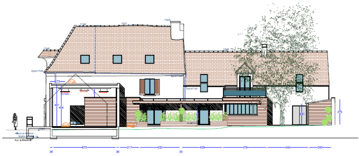
COUPE AA FACADE NORD OUEST SUR PATIO