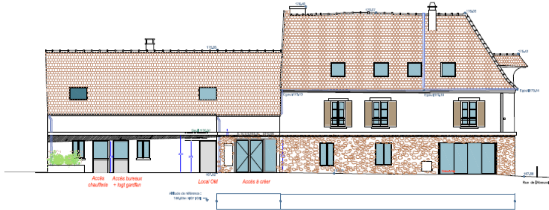
FACADE SUD EST AV JEAN JAURES Variante 1 : bandeau positionnée à 2.40m