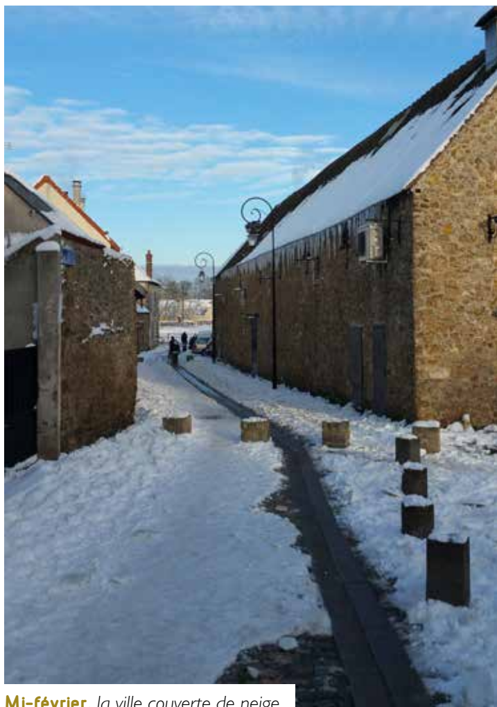
Mi-février , la ville couverte de neige.

Le 2 février , les conteurs de Trappes ont enchanté les jeunes élèves de la ville à l'école de musique et de danse.