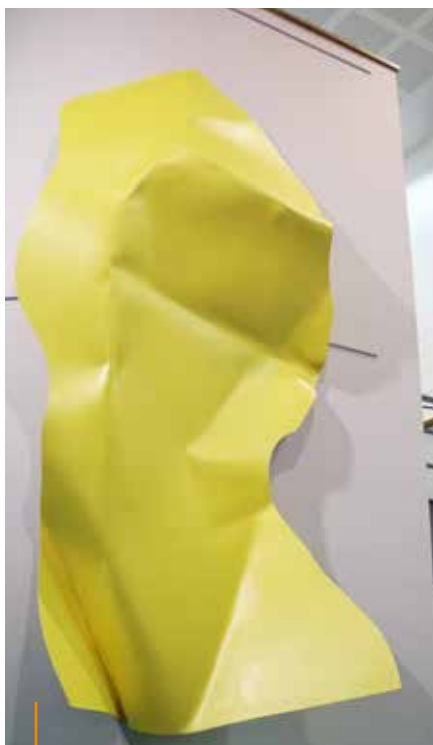
Découvrez l'exposition Sonotropie , du plasticien Samuel Aligand jusqu'au 29 mars