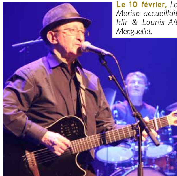
Le 10 février , La Merise accueillait Idir & Lounis Aït Menguellet.