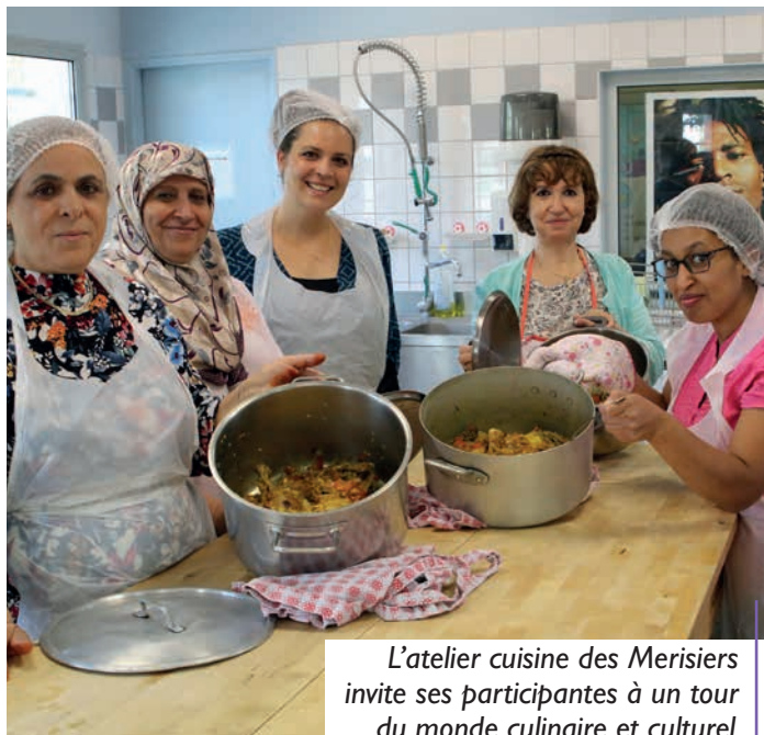
L'atelier cuisine des Merisiers invite ses participantes à un tour du monde culinaire et culturel.