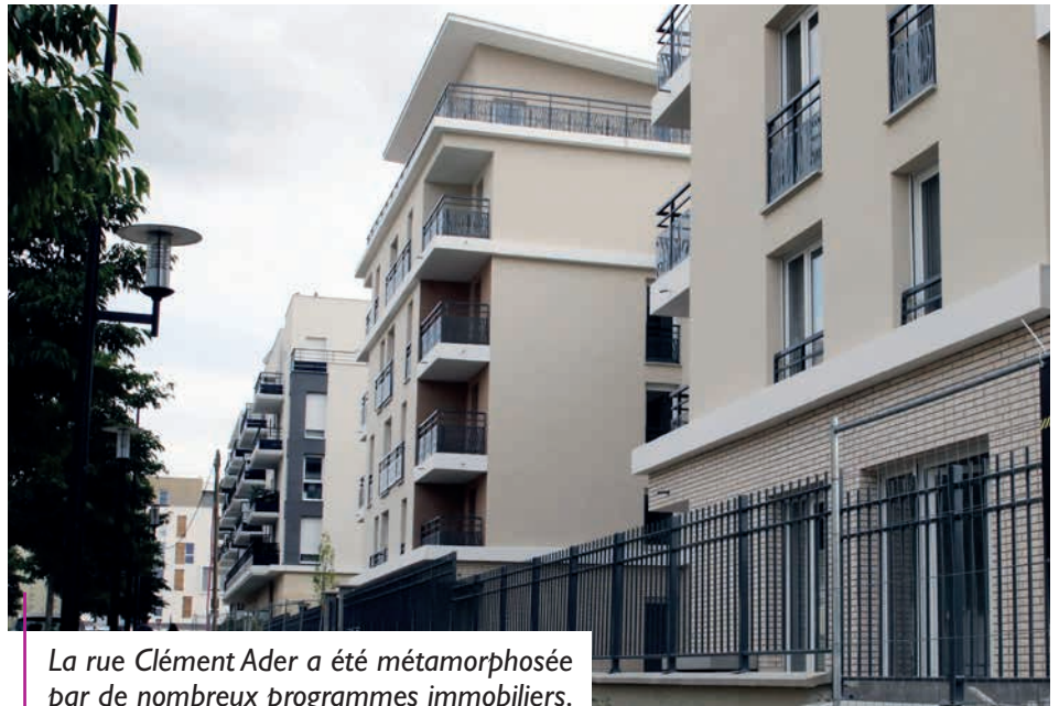
La rue Clément Ader a été métamorphosée par de nombreux programmes immobiliers.

Dans les rues aux noms d'aviateurs de l'Aérostat, de nouveaux immeubles s'élancent vers le ciel. Bien avancée, cette seconde tranche de constructions, sous l'égide de la communauté d'agglomération de Saint-Quentin-en-Yvelines, densifie la zone d'aménagement concertée. Elle combine accession à la propriété, logement social, locatif privé... Au cœur du nouveau quartier, la métamorphose de l'avenue Clément Ader, où de nombreux programmes immobiliers battent leur plein ou viennent d'aboutir, est frappante. Les appartements en accession (Promogym, Polycités) côtoient les logements individuels ainsi qu'un immeuble du bailleur Valophis-Sarepa. Au bout de cette même rue, d'immenses panneaux (Crédit Agricole) annoncent 110 nouveaux logements. Quelques centaines de mètres plus loin, un immeuble (Arche Promotion) complète la perspective de la rue Maryse Bastié. A l'angle des rues Koprivnice et Bobby Sands, une résidence sociale (Adoma) ouvrira cet automne. Trois cent cinquante-quatre logements, dont 15% de logements sociaux, sont prévus dans le cadre de cette nouvelle tranche. La troisième et dernière tranche s'échelonne ensuite jusqu'en 2020.