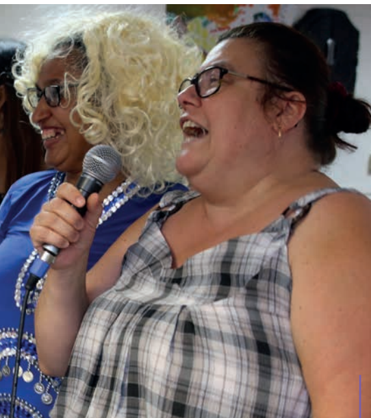
A Moro, des soirées conviviales sont mises en place par les habitants.