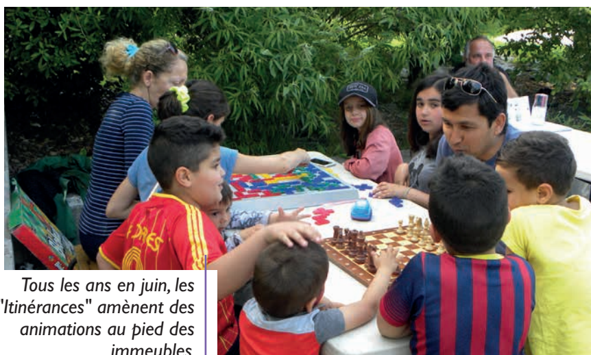
Tous les ans en juin, les "Itinérances" amènent des animations au pied des immeubles.