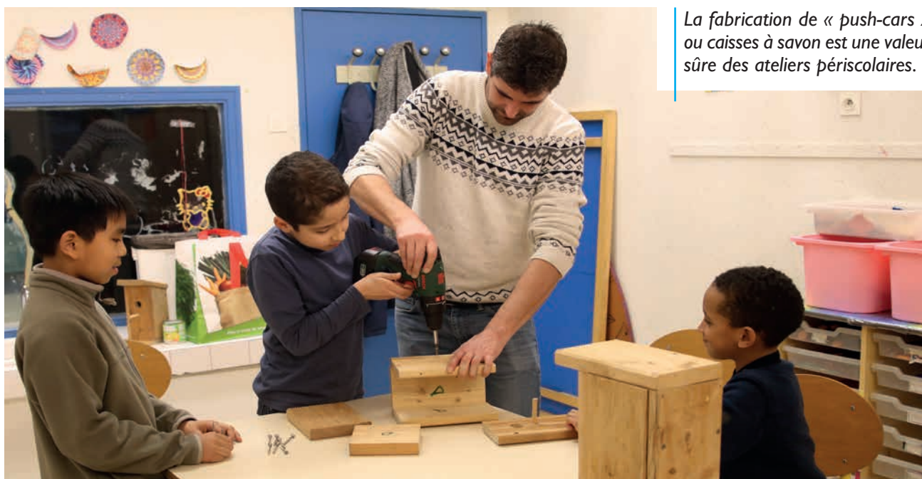
La fabrication de « push-cars » ou caisses à savon est une valeur sûre des ateliers périscolaires.

L'individualisation des parcours périscolaires qui a permis l'an dernier de suivre plus de 200 élèves en difficulté se poursuit en 2017-2018. S'inscrivant pleinement dans le projet éducatif de territoire, elle privilégie la coopération entre acteurs éducatifs dans l'intérêt de l'enfant. Dans chaque établissement, une équipe regroupant référent