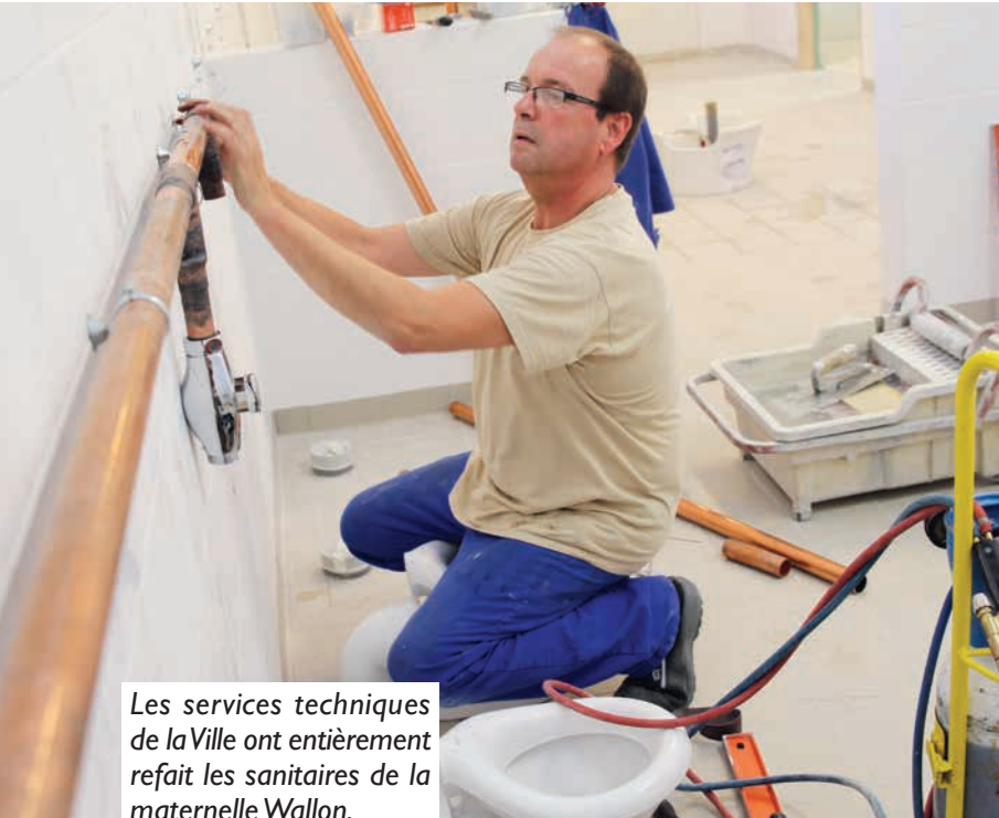
Les services techniques de la Ville ont entièrement refait les sanitaires de la maternelle Wallon.