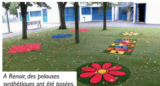
A Renoir, des pelouses synthétiques ont été posées.